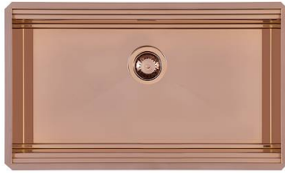
Fregadero Milanello Copper Workstation