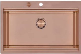
Fregadero Milanello Copper workstation